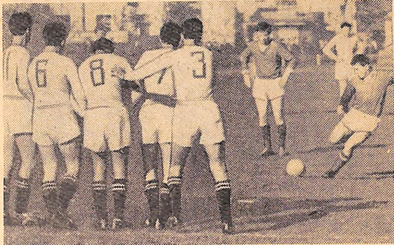
Сейчас пробуют штрафной по нашим воротам. Однако защита встала на пути мяча поистине непробиваемой стеной...